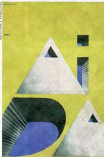
Plakat Romana Cieślewicza, 1966

– plakat operowy 1945–2012”). To pierwsza taka podjęta przez Muzeum Plakatu próba szerszego spojrzenia na własną kolekcję teatralnego plakatu obcego. Możemy tu zobaczyć aż 250 plakatów z różnych stron świata.