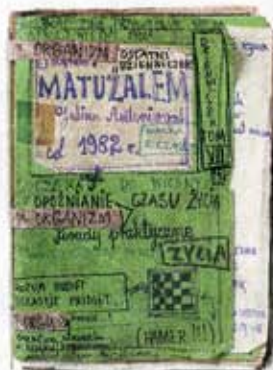
Notatnik Antonisza w Zachęcie